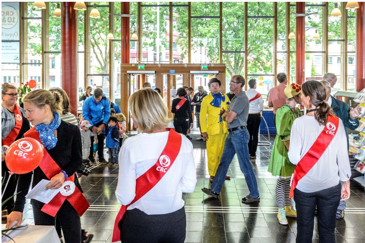
Under 2016 var det 10 år sedan Clinical Research Centre (CRC) i Malmö invigdes. Det firades bland annat med Öppet hus för allmänheten den 18 augusti.

Kommunikation är också en framtidsfråga, en förnyelse av institutionens externa webbnärvaro pågår, dels med introduktionen av forskningsportalen LUCRIS, dels översyn och omläggning av webbsidor till verktyget Drupal. IKVM arbetar här enligt gemensamma riktlinjer från fakultetskansliet. Arbetet fortsätter under 2017 och gäller även webbplatser för LUDC och andra centrumbildningar med koppling till institutionen.