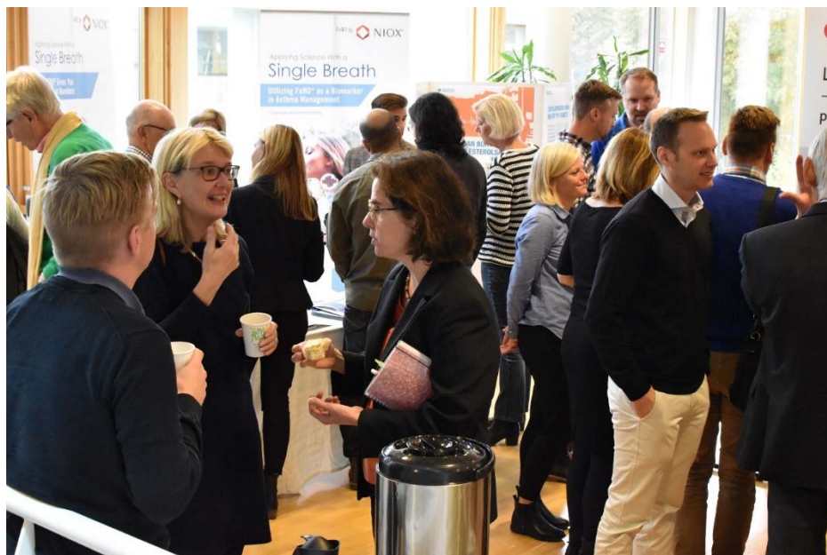
Framtidens primärvård arrangerades den 6 oktober 2016.

Under Almedalsveckan medverkade institutionens diabetesforskning som en del av universitetets gemensamma program den 7 juli med seminariet "Individanpassad vård för diabetes – bättre diagnos ger bättre prognos".