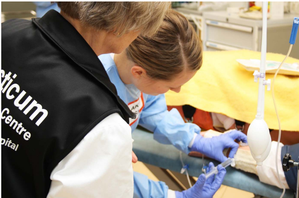
Läkarstudenterna i Malmö tränar akutvård bland annat i simulatormiljö på Practicum Clinical Skills Centre.

metoder inom bioteknologi och genetik. Den kliniknära forskningen utvecklar och utvärderar ny behandling och metodologisk innovation i patientvården och i operationssalarna inom såväl hög-specialiserad vård som för de sjukdomar och tillstånd som drabbar många.